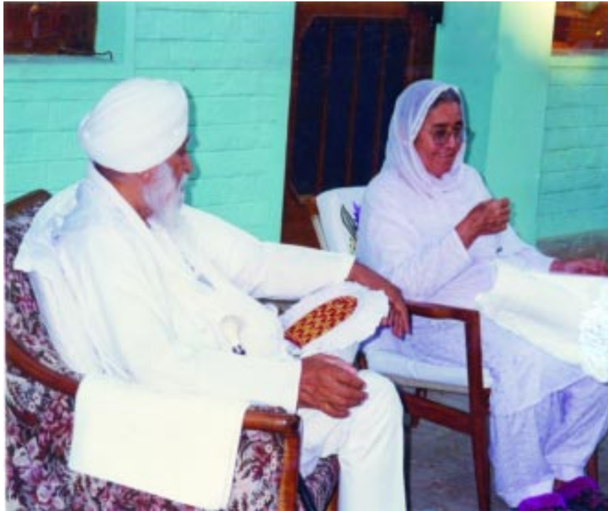
ਸੰਤ ਮਹਾਰਾਜ ਰਤਵਾੜਾ ਸਾਹਿਬ ਅਤੇ ਪਰਮ ਪੂਜਯ ਸਤਿਕਾਰਯੋਗ ਬੀਜੀ ਜੀ ਰਤਵਾੜਾ ਸਾਹਿਬ ਵਿਖੇ

ਤਾਕਤ ਪੋਲੀਟੀਕਲ ਹੋਰ ਫੇਰ ਹੋਣ ਦੇ ਨਾਲ ਕਮਜ਼ੋਰ ਹੋ ਗਈ। ਉਸ ਤੋਂ ਬਾਅਦ ਮੈਂ ਫੌਜ ਵਿਚ 10 ਸਾਲ ਨੌਕਰੀ ਕਰੀ। 14.4.1941 'ਚ ਸ਼ੁਰੂ ਕਰਿਆ ਸੀ, 14.4.1952 ਵਿਚ ਮੈਂ ਸਿਵਲ ਵਿਚ ਚਲਿਆ ਗਿਆ, ਸੈਕਟਰੀਏਟ 'ਚ। ਫੌਜ ਵਿਚ ਵੀ ਮੈਂ ਦੀਵਾਨ ਲਾਉਂਦਾ ਸੀ ਉਸੇ ਤਰ੍ਹਾਂ ਹੀ, ਜਦੋਂ ਸਿਵਲ ਸੈਕਟਰੀਏਟ 'ਚ ਗਿਆ ਉਥੇ ਕਈ ਬੰਦੇ ਇਸੇ ਰੁਝਾਨ ਦੇ ਸੀ, ਦੂਰ-ਦੂਰ ਤੋਂ ਸਾਰੇ ਪੰਜਾਬ ਤੋਂ, ਹੋਰ ਥਾਵਾਂ ਤੋਂ ਆਏ ਹੋਏ ਸੀ ਤੇ ਭਜਨ ਬੰਦਗੀ ਵਾਲਾ ਇਕ ਗਰੁੱਪ ਬਣ ਗਿਆ ਸੀ ਸਾਡਾ। ਉਨ੍ਹਾਂ ਨੇ ਇਕ ਦਿਨ ਸਵਾਲ ਕਰ ਦਿਤਾ ਕਿ ਨਾਮ ਕੀ ਹੁੰਦਾ ਹੈ? ਮੈਨੂੰ ਕਹਿਣ ਲੱਗੇ ਕਿ ਤੁਸੀਂ