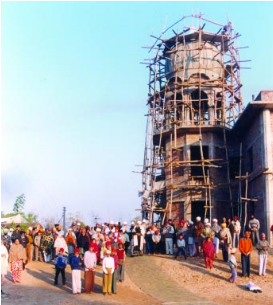
ਅਭੁੱਲ ਯਾਦ ਗੁਰਦੁਆਰਾ ਈਸ਼ਰ ਪ੍ਰਕਾਸ਼ ਰਤਵਾੜਾ ਸਾਹਿਬ ਦੀ ਉਸਾਰੀ ਸਮੇਂ ਸੰਤ ਮਹਾਰਾਜ ਸੰਗਤਾਂ ਵਿੱਚ

ਦਸਵੇਂ ਪਾਤਸ਼ਾਹ ਉਥੇ ਰਹੇ। ਸ਼ਹੀਦਾਂ ਦਾ ਜਿਹੜਾ ਖੂਨ ਹੈ ਉਤੇ ਕਣ-ਕਣ ਦੇ ਉਤੇ ਡੁਲਿਆ ਹੋਣ ਦੇ ਬਾਵਜੂਦ ਵੀ ਉਥੇ ਸਿੱਖੀ ਦਾ ਨਾਮ ਨਿਸ਼ਾਨ ਨਹੀਂ ਸੀ। ਸ਼੍ਰੋਮਣੀ ਕਮੇਟੀ ਦੇ ਉਥੇ ਪ੍ਰਚਾਰਕ ਵਗੈਰਾ ਫਿਰਦੇ ਸੀ ਵਿਚਾਰੇ helpless ਮਜ਼ਬੂਰ ਸੀ, ਕੁਛ ਬਣਿਆ ਨਹੀਂ ਸੀ ਉਨ੍ਹਾਂ ਦਿਨਾਂ ਵਿਚ। ਜਦੋਂ ਇਹ ਲਹਿਰ ਬਣੀ ਉਸ ਵੇਲੇ ਸਭ ਲੋਕ ਇਕੱਠੇ ਹੋ ਗਏ। ਤਮਾਕੂ ਦੀ ਕਾਸ਼ਤ ਬੰਦ ਹੋ ਗਈ, ਜਰਦਾ ਖਾਣ ਤੋਂ ਮੈਂ ਬੰਦ ਕਰ ਦਿਤੇ ਤਾਂ ਸਿੱਖੀ ਦੀ ਲਹਿਰ ਚਲ ਪਈ। ਸਿੱਖੀ ਦੀ ਲਹਿਰ ਐਨੀ ਚੱਲੀ ਕਿ ਸਾਰੇ ਪਿੰਡਾਂ ਦੇ ਅੰਦਰ ਕੀਰਤਨ ਸ਼ੁਰੂ ਹੋ ਗਿਆ। ਦੂਸਰਾ ਮੈਂ ਕਿਹਾ ਕਿ ਤੁਸੀਂ ਗੁੰਝੀਆਂ ਦੇ ਸਿਰ ਤੇ ਨਾ ਰਹੋ, ਤੁਹਾਨੂੰ ਮੈਂ ਪੜ੍ਹਾਉਂਦਾ ਹਾਂ, ਕੀ ਰ ਤ ਨ ਸਿਖਾਉਂਦਾ ਹਾਂ, ਤੁਸੀਂ ਆਪਣੇ ਇਲਾਕੇ ਦੇ ਅਨੰਦ ਕਾਰਜ ਆਪ ਕਰੋ। ਆਪਣੇ ਆਪ ਅਖੰਡਪਾਠਾਂ ਦੇ ਭੋਗ ਪਾਓ। ਤੁਸੀਂ ਕਿਉਂ ਇਨ੍ਹਾਂ ਤੇ ਨਿਰਭਰ ਹੁੰਦੇ ਹੋ। ਸੋ ਉਨ੍ਹਾਂ ਨੇ ਮੇਰੀ ਗੱਲ ਮੰਨੀ। ਅੱਜ ਹਰ ਪਿੰਡ ਦੇ ਵਿਚ ਜਥਾ ਹੈ ਜਿਹੜਾ ਆਪਣਾ ਕੰਮ ਆਪ ਕਰਦਾ ਹੈ। ਸੋ ਇਸ ਤਰ੍ਹਾਂ ਦੇ ਨਾਲ ਮੈਂ ਉਸ ਥਾਂ ਦੇ ਉਤੇ ਪ੍ਰਚਾਰ ਕਰਦਾ ਰਿਹਾ। ਸਭ ਕੁਛ ਗੁਰੂ ਮਹਾਰਾਜ ਨੇ ਮੇਰੇ ਤੋਂ ਕਰਾਇਆ, ਮੈਂ ਨਹੀਂ ਕਰਿਆ। ਪਰ ਸਾਡਾ ਤਾਂ ਇਹ ਅਸੂਲ ਜਿਹੜਾ ਮੇਰਾ ਅੰਦਰ ਦਿਲ 'ਚੋਂ ਹੈ, ਉਹ ਇਹ ਹੈ ਕਿ ਮੈਂ ਆਪਣਾ ਫਰਜ਼ ਸਮਝਦਾ ਸੀ। ਮੈਂ ਇਸ ਕਰਕੇ ਨਹੀਂ ਸੀ ਕਰਦਾ ਕਿ ਮੈਨੂੰ ਕੋਈ ਕਰੇ ਜਾਂ ਮੈਨੂੰ ਕੋਈ ਕੁਛ ਦੇਵੇ। ਉਥੇ ਪ੍ਰਚਾਰ ਹੋਣ ਦਾ ਕਾਰਨ ਇਹ ਸੀ। ਉਹ ਇਲਾਕਾ ਜਿਹੜਾ ਸੀ ਉਹ ਗਰੀਬ ਸੀ, ਫਸਲਾਂ ਉਥੇ ਹੁੰਦੀਆਂ ਨਹੀਂ ਸੀ। ਗਰੀਬ ਲੋਕ ਸੀਗੇ। ਦੁੱਧ ਵੇਚ ਦਿੰਦੇ ਸੀ, ਉਨ੍ਹਾਂ ਵਿਚ ਤਾਕਤ ਹੈ ਨਹੀਂ ਸੀ, ਉਹ ਨਸ਼ੇ ਵਰਤ ਕੇ ਆਪਣੇ ਦਿਨ ਪੂਰੇ ਕਰਦੇ ਸੀ। ਨਸ਼ੇ