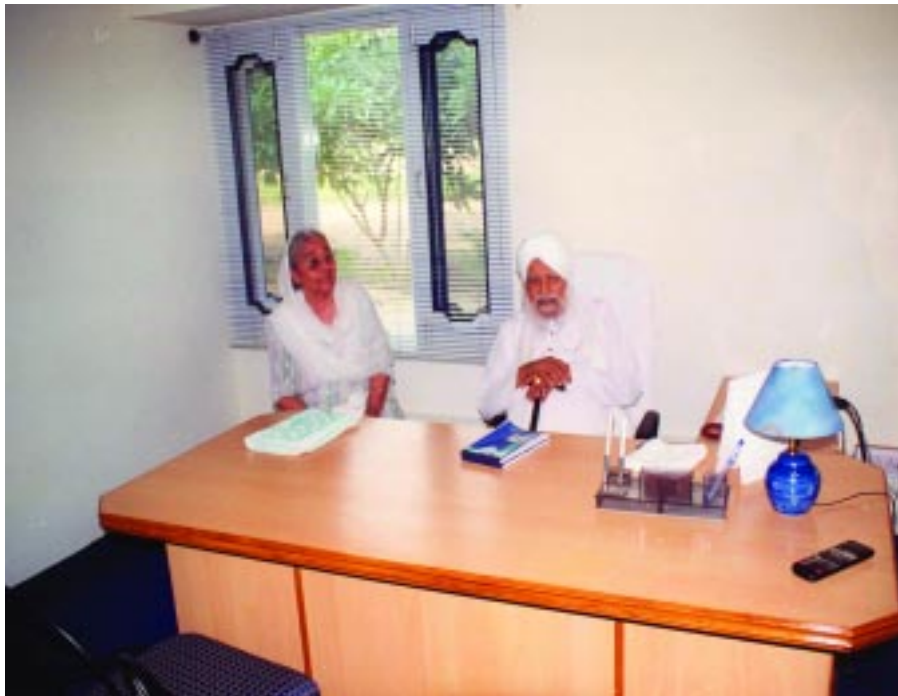
ਪਰਮ ਸਤਿਕਾਰਯੋਗ ਬੀਜੀ ਅਤੇ ਸੰਤ ਮਹਾਰਾਜ ਜੀ ਰਤਵਾੜਾ ਸਾਹਿਬ ਵਿਖੇ ਆਈ.ਟੀ. ਕਾਲਜ ਵਿਖੇ

ਮੁਰਗੇ ਨਹੀਂ ਇਥੇ ਮਿਲਣੇ। ਕਹਿੰਦਾ ਮੈਂ ਤਾਂ ਖਾਂਦਾ ਹੀ ਨਹੀਂ। ਮੈਂ ਤਾਂ ਤੁਹਾਡੇ ਨਾਲ ਬੜੀ ਖੁਸ਼ੀ ਮਹਿਸੂਸ ਕਰਦਾ ਹਾਂ ਤੇ ਤੁਸੀਂ ਮੈਨੂੰ ਬੈਠ ਕੇ ਪ੍ਰਸ਼ਾਦਾ ਛਕਾ ਦਿਓ। ਬੇਅੰਤ ਇਕੱਠੇ ਹੋ ਗਏ ਲੋਕ, ਕਿਉਂਕਿ ਜਿਥੇ ਪੁਲਿਸ ਜਰਨੈਲ ਹੈ ਉਥੇ ਆਉਣਾ ਹੈ ਸਾਰਿਆਂ ਨੇ। ਉਹਨੇ ਪ੍ਰਸ਼ਾਦਾ ਛਕਣ ਤੋਂ ਬਾਅਦ ਇਕ ਗੱਲ ਕਹੀ ਕਿ ਮੈਂ ਇਥੇ ਕਿਉਂ ਆਇਆਂ? ਮੇਰੀ ਜਦ ਕਿ ਵੱਡੇ-ਵੱਡੇ ਆਦਮੀ ਮਿੰਨਤਾਂ ਕਰਦੇ ਨੇ, ਖੁਸ਼ਾਮਦਾਂ ਕਰਦੇ